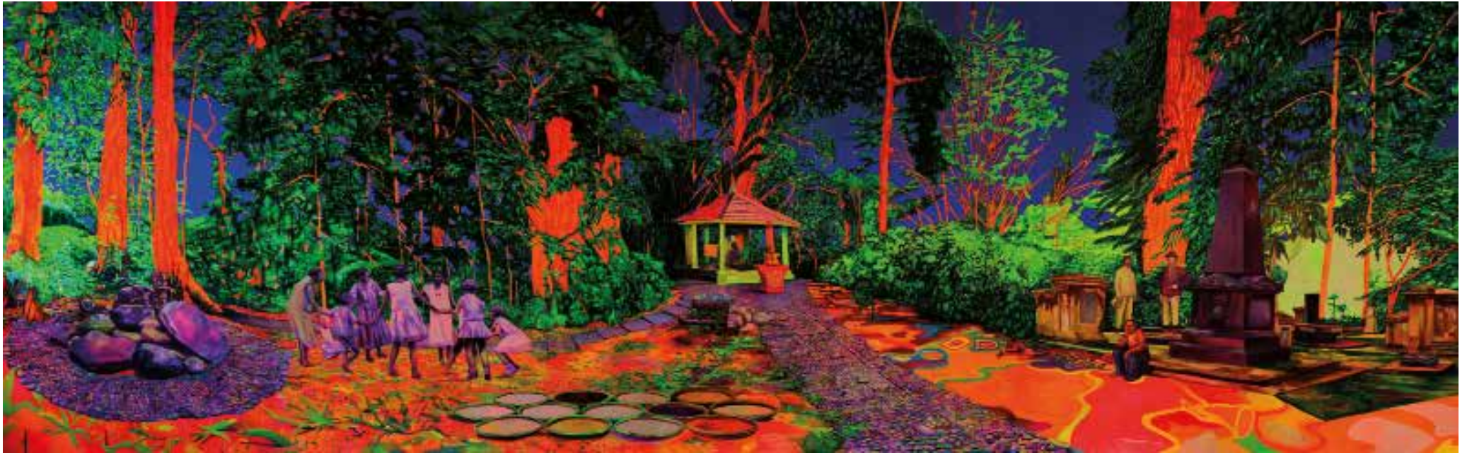
Zico Albaiquni - Ruwatan Tanah Air Beta, Reciting Rites in its Sites (2019), Courtesy van de kunstenaar en Yavuz Gallery

Albaiquni's ongewone en intrigerende kleurenpalet is ontwikkeld op basis van de kleurformules van deze vroege schildertraditie. Zijn grootschalige werken dagen conventionele perspectieven en formaten uit.