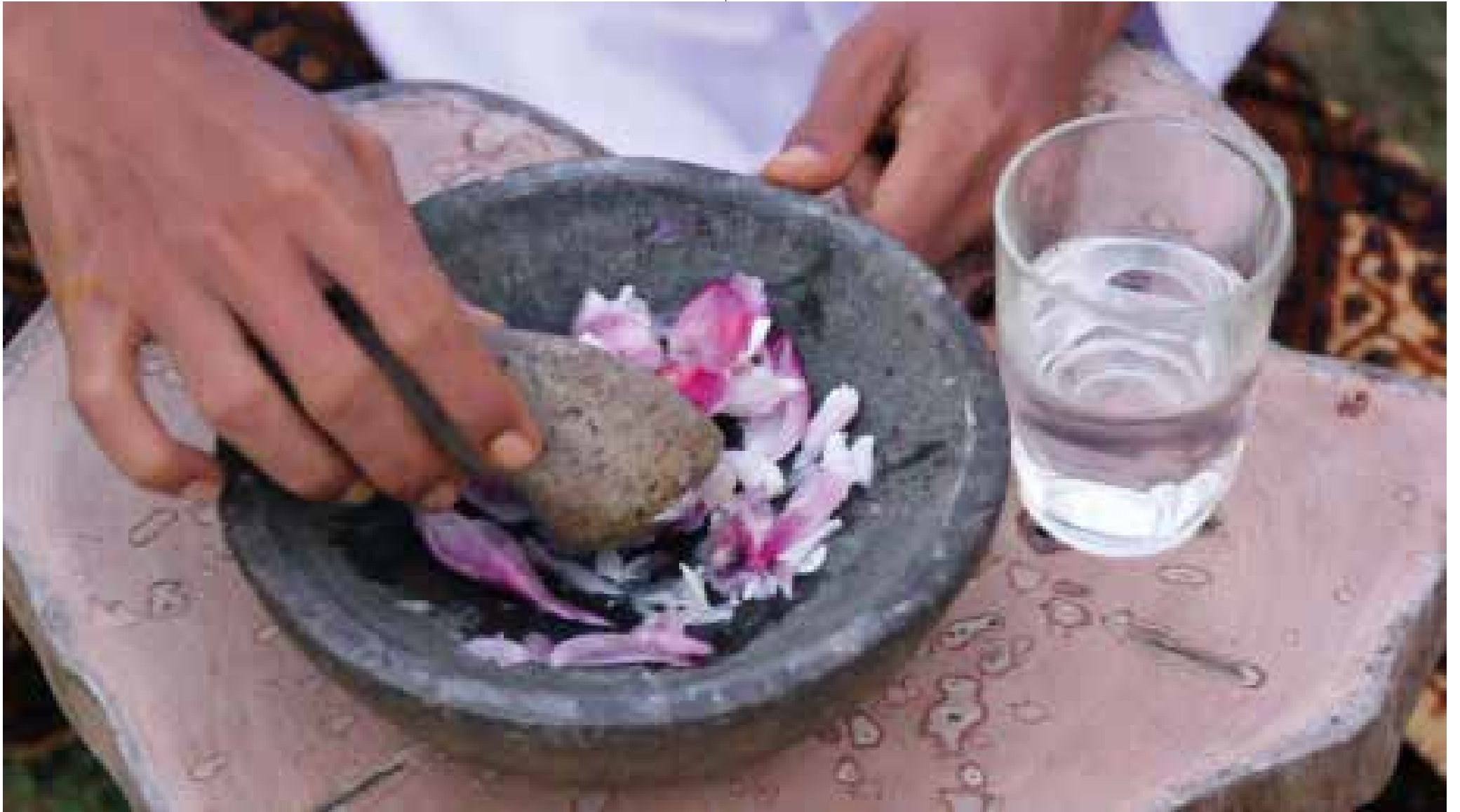
Lifepatch - Spectacular Healing (2019)